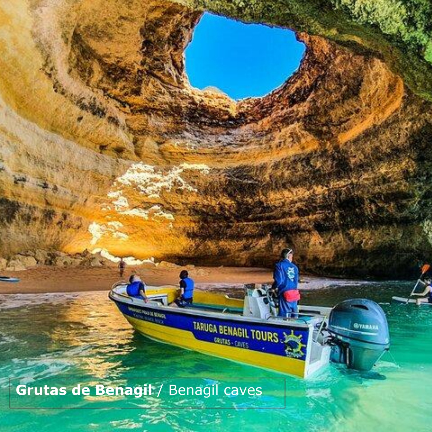
Grutas de Benagil / Benagil caves